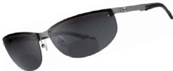
NV1 - die Edle