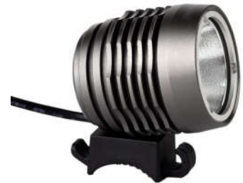
Black Sun III