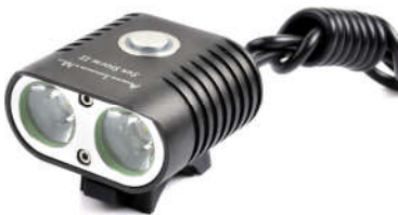
Sun Storm II