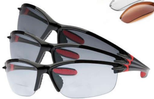
SL2 Pro photopolar

Die SL2 Pro ist eine bifokale Sportlesebrille allerhöchster Qualität, die Sie in zwei Varianten beziehen können: